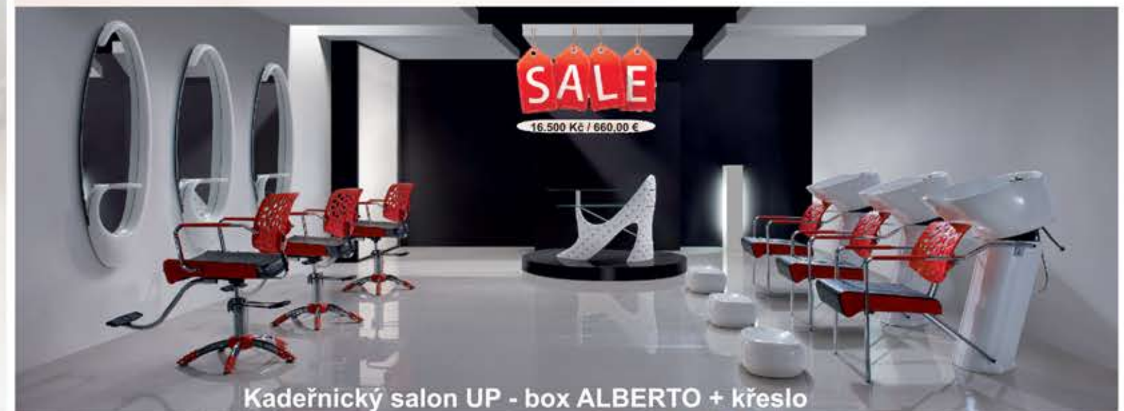
Kadeřnický salon UP - box ALBERTO + křeslo