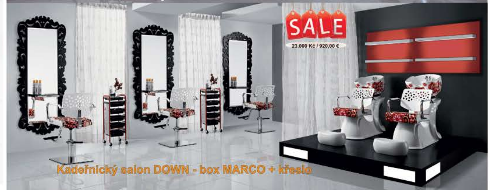
Kadeřnický salon DOWN - box MARCO + křeslo